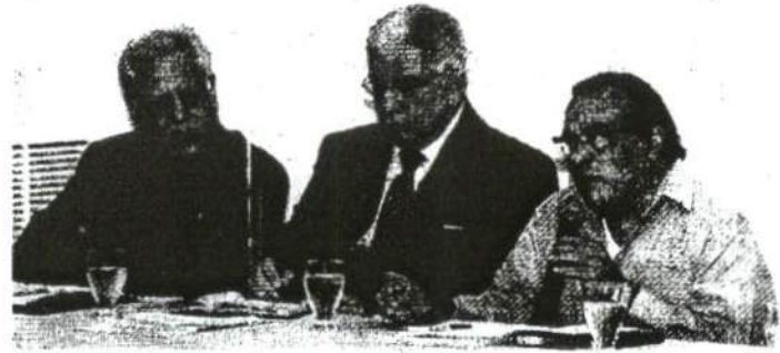
La Comisión de Reforma y Seguridad aseguró que con consultores internacionales se realizará un diagnóstico y evaluación completa del Ministerio Público.

LARAgb C/O: Sr. María Otero, Secretaría de Asuntos Globales, Departamento de Estado Washington DC C/O: Arebio